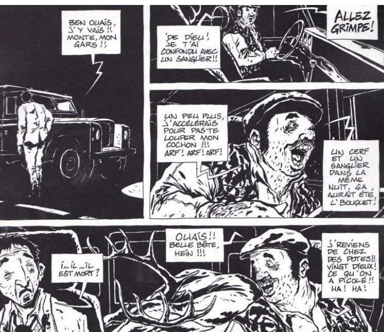
Pleine Lune/Chabouté/Vents d'Ouest

Deux BD noires, très noires. Une balade dans les méandres de l'esprit humain où les pires penchants s'expriment.