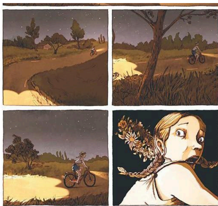
Le prédicateur/ Bischoff et Bocquet/Casterman